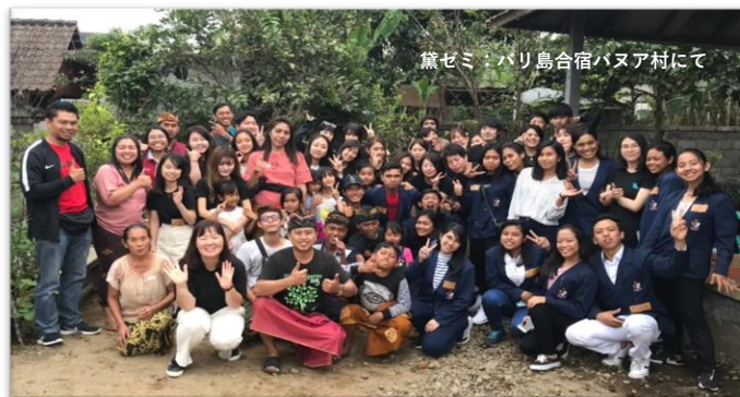
黛ゼミ・バリ島合宿バヌア村にて