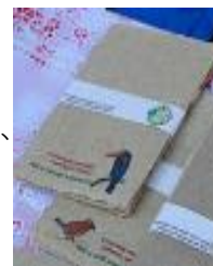
紙すきのポストカード